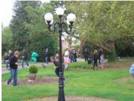
Il y en avait partout, des œufs