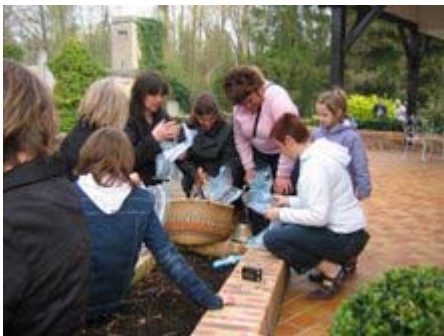
le moment du partage