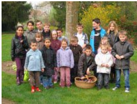
le groupe de chasseurs...d'œufs !