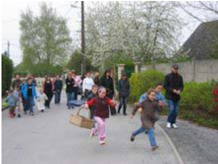
Chasse aux œufs ? plutôt chasse à course !

Tout ce petit monde a ensuite partagé équitablement la récolte, satisfait de cette heureuse initiative qui leur a permis de passer bon moment et de se régaler d'œufs en chocolat.